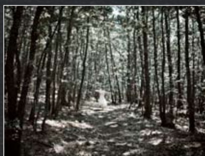
4. Simona Ghizzoni